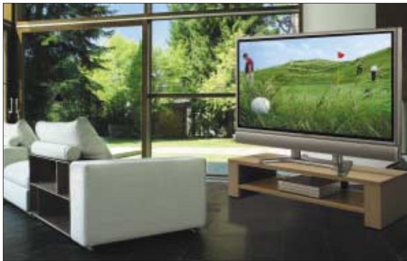
Nur nahe am Bildschirm können unsere Augen von der Full HD Auflösung profitieren